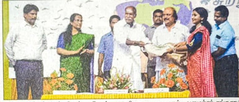
உலக கற்றுச்சூழல் தினத்தைப்பொட்டி துணி பைகளை முதல்-அமைச்சர் ரங்கசாமி வெளியிட்டபோது எடுத்த படம்.

விழாவில் முதல்-அமைச்சர் ரங்கசாமி கலந்துகொண்டு பல்வேறு போட்டிகளில் வெற்றி பெற்றவர்களுக்கு பரி சுகளை வழங்கி பேசினார். அப்போது அவர் கூறியதா வது- புதுவையில் தற்போது நிலத்தடி நீர் மட்டம் குறைந்து கொண்டே வருகிறது. இதற்கு காரணம் மழைநீர் சேகரிப்பு மிகவும் குறைவு. புதுவையில் ஒரு முறை பயன்படுத்தும் பிளாஸ்டிக் பொருட்களுக்கு தடை விதிக்கப்பட்டுள்ளது. இருப்பினும் சிலர் கள்ள மாகர்க்கெட்டில் அதனை வாங்கி பயன்படுத்தி வருகின் றனர். இந்த பொருட்களை கிழிபோடுவதால் மண்ணில் தங்கி விடுகிறது. இதனால்