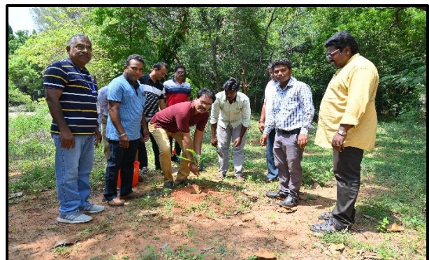
Photo clips of Mangrove Lagoon Clean-up & Tree Plantations