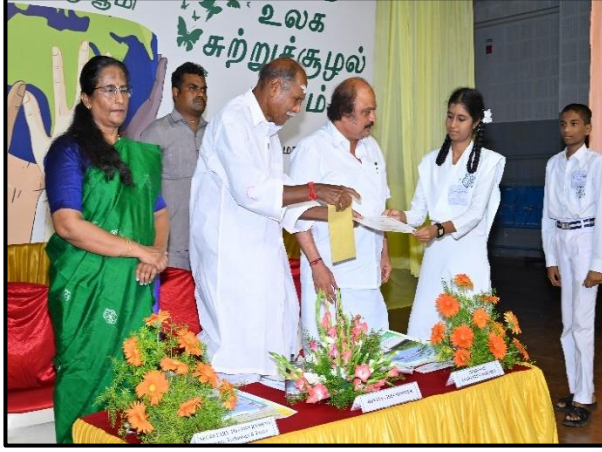
Photo clips of Prize Distributions